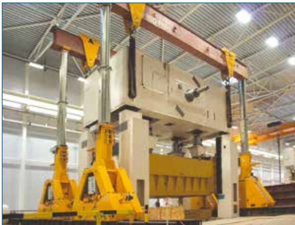
◀ Gru a cavalletto idraulica serie SBL-1100.