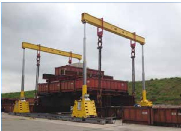
◀ Portique de la série SL-400 pendant un test de charge.